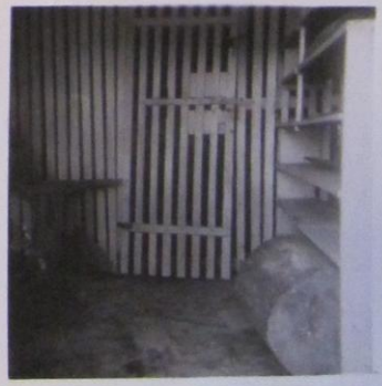
2 st. andra bilder av spjöldörren.