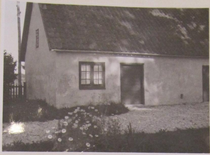
Flygelbyggnaden var det nämnda förrådet är in- rymt vid prästgården i Lärbro.

från inbrotten i det krigs sjukhuset i Lärbro tillhöriga läkemedelsförrådet.