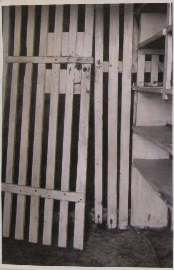
Spjöldörren till förråderummet.